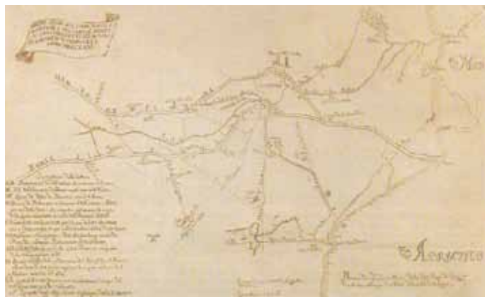
Bernardino Zandrini 1731, progetto di diversione e rettificazione di Ronco e Montone utilizzando la bocca del porto canale pamphilio

Una festa del fiume e della città perché ora i Fiumi Uniti non scorrono ad oltre due chilometri da Ravenna, ma ne sono parte integrante, un 'ponte' che collega il centro al mare. Un 'parco fluviale' su cui la Città tutta dovrebbe investire perché ricco di potenzialità costituendo un percorso naturale dalla Città d'Arte al mare, alle dune, alle pinete ravennati. Un itinerario percorribile a piedi e in bici – come fanno tanti ravennati ogni giorno – ma anche in canoa. Sono numerosissime le associazioni che hanno aderito a questo progetto che vuole al tempo stesso sottolineare l'importanza dello sport in natura, della cultura del territorio e delle sue tradizioni. Un movimento che attiva ampie sinergie esprimendo al meglio le potenzialità dei singoli soggetti dimostrando che lo sport è democrazia, capacità di aggregazione e salute, ma che può anche divenire volano di sviluppo e costruzione consapevole del futuro.