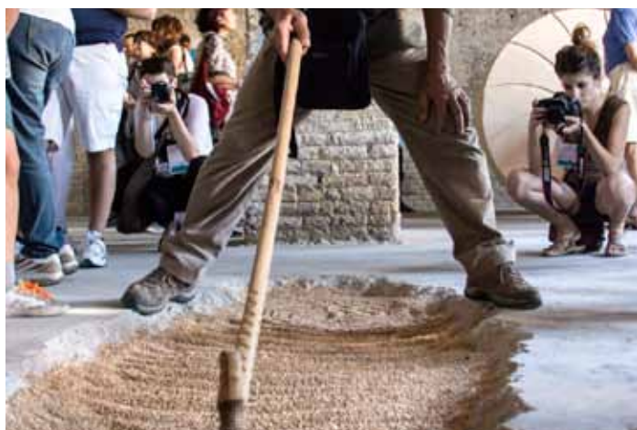
Trekking Urbano Ravenna Città d'acque, 2013 (Molino Lovatelli)

Urban Trail Ravenna Città d'acque, 2013, 2104 (Fiumi Uniti)