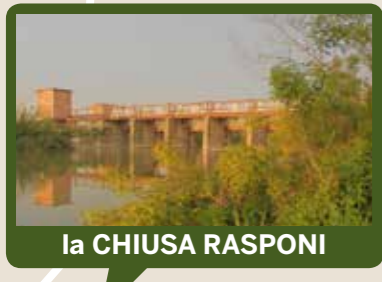
la CHIUSA RASPONI